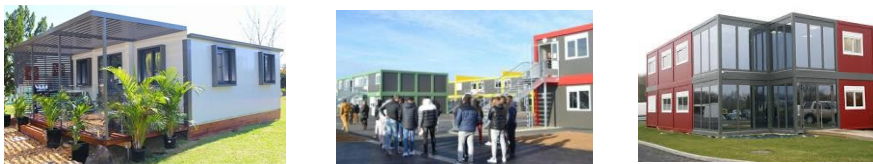
Camping, tourisme saisonnier, école-lycée temporaires, pensionnat, bureaux...