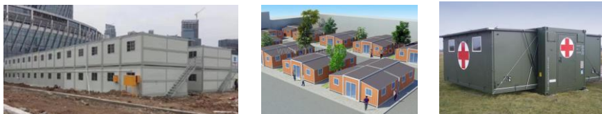
Base vie, relogement de populations sinistrées, hébergements temporaires,