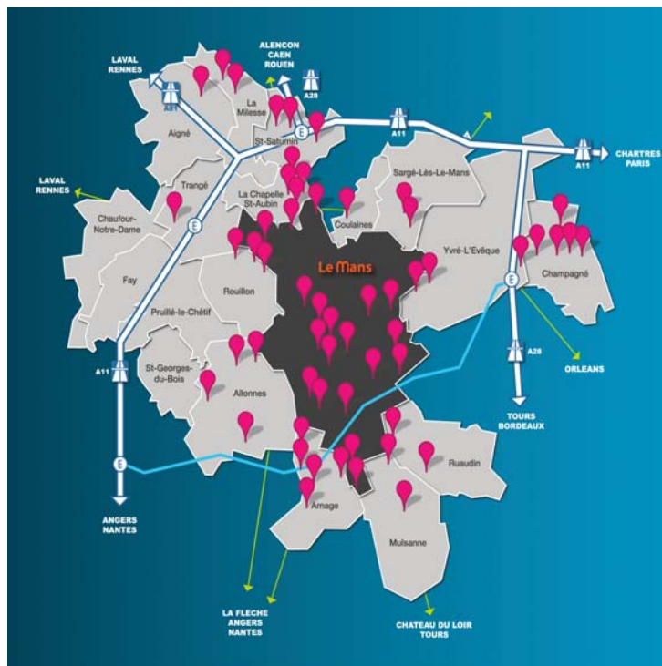
Le Mans Métropole – 57 zones d'activités