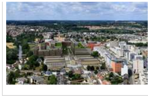
Tableau comparatif des prix de bureaux Paris/ Le Mans Lire !